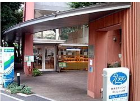
(写真：天気の良い日の就労センター「街」1Fはパン屋さんです)

グループホームに入居し親元を離れての暮らしを始めた方、しばらく離れていた仕事の機会が訪れた方、結婚されたスタッフなど、それぞれの思い切って踏み出した一歩、それが暮らしに節目をもたらしている今があり、その中での思いや戸惑いや希望を語り合いました。その一方、膝や腰の痛みが去らず、この辺が潮時かと仕事から離れることが脳裏をかすめる時があると語る方もあり、現役を離れた自分の今と重ねてその思いをお聞きしました。いずれにしろこの日集った一人ひとりの「今からここから」に思いを馳せる集いでした。